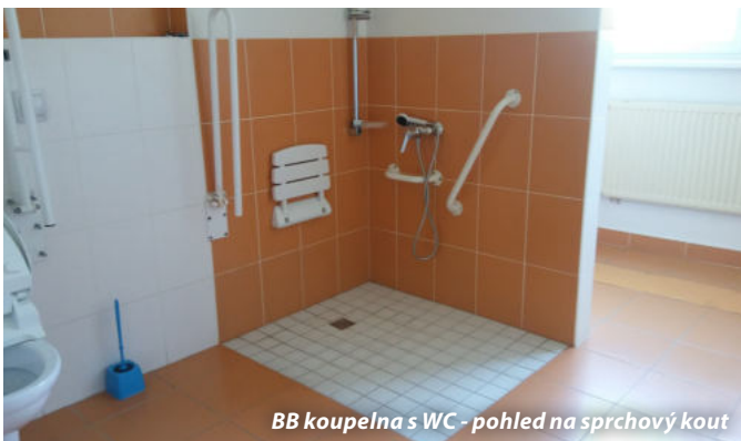
BB koupelna s WC - pohled na sprchový kout