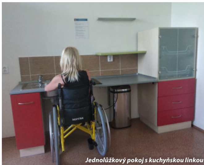
Jednolůžkový pokoj s kuchyňskou linkou