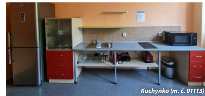
Kuchyňa (m. č. 01113)

Objekt je využíván pro potřeby TUL pouze v 1. NP (budova C) k ubytování osob s těžkým pohybovým postižením. Pro osoby se zrakovým postižením využívat lze, ale není speciálně upraven. Omezení pro osoby na elektrickém vozíku je na přístupové chodbě mezi schodištěm a ubytovacími jednotkami. Tvoří ho požární uzávěry u dveří, kdy aktivní křídlo má šířku pouze 725 mm. Prostorová orientace je bez obtíží.