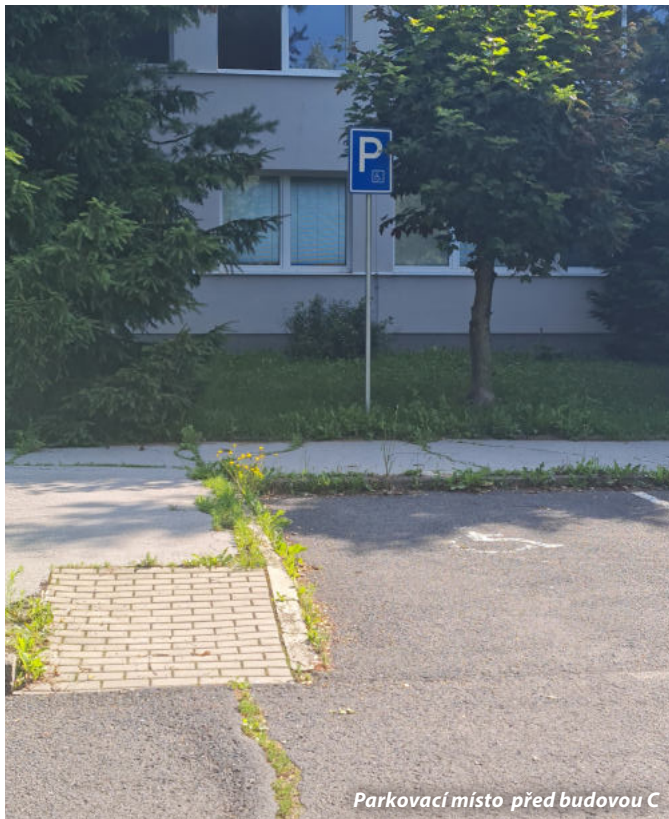
Parkovací místo před budovou C

Akusticky orientační majáček (AOM) není u hlavního vstupu osazen.