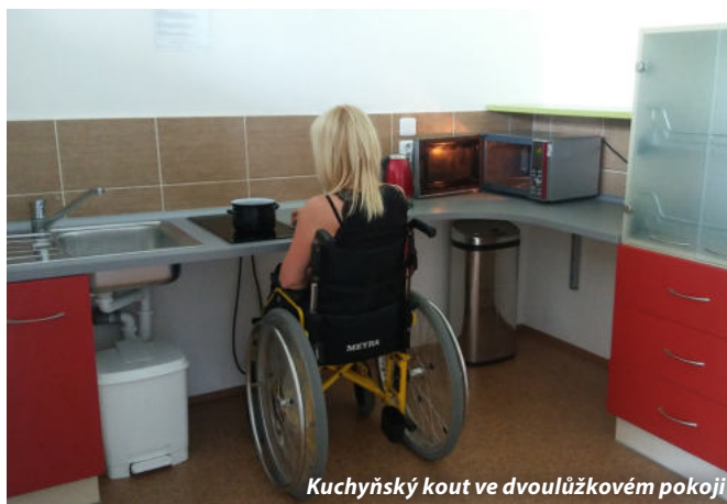
Kuchyňský kout ve dvoulůžkovém pokoji