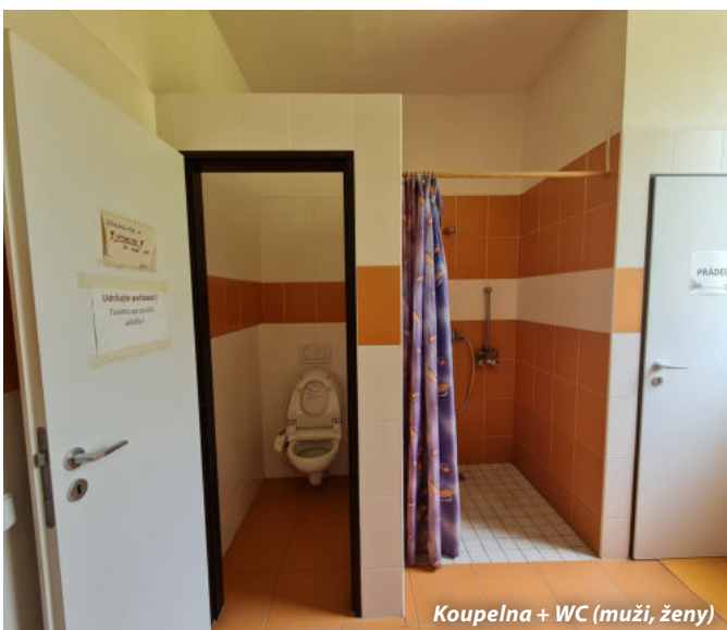
Koupelna + WC (muži, ženy)