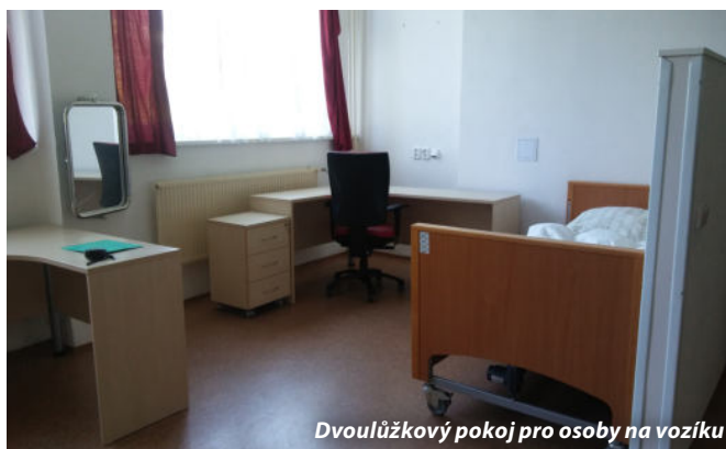
Dvoulůžkový pokoj pro osoby na vozíku