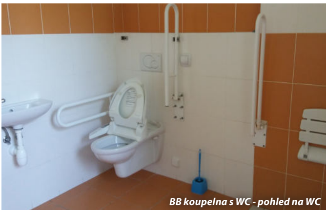
BB koupelna s WC - pohled na WC