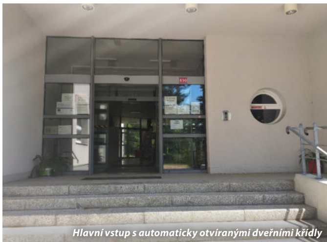
Hlavní vstup s automaticky otvíranými dveřními křídly